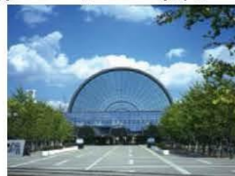
インテックス大阪